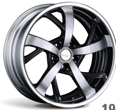
GUNMETAL POLISH + BLACK CLEAR