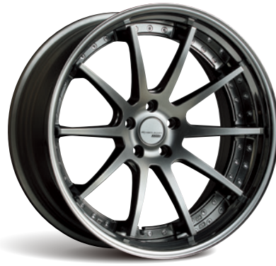
FLAT TITAN (スーパーコンケイブ) STEP RIM