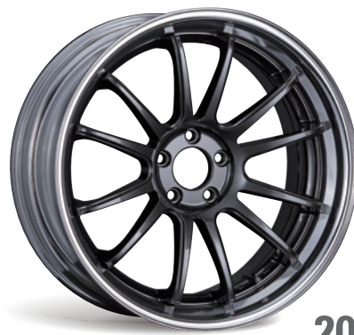
PRISM DARK GUNMETAL (スーパーコンケイブ) STEP RIM