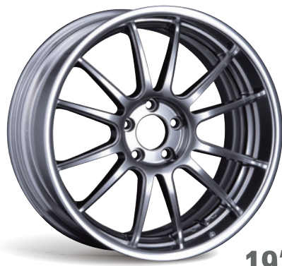
TITAN SILVER (スタンダードコンケイブ)

TPMS 対応 オーダーメイド INSET ステップ リム 2 PIECE CONSTRUCTION M14 対応 (60'テーパー) ※type12Sのみ