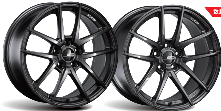
DARK GUNMETAL FACE-SMI 18"