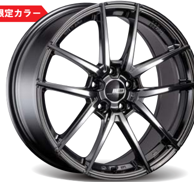
SUPER BLACK COAT FACE-SMI 20"